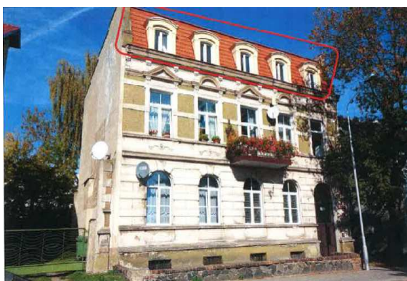
Widok elewacji frontowej – ul. Izerska 6

Nieruchomość będąca lokalem mieszkalnym Nr 3 znajduje się na trzeciej kondygnacji wielorodzinnego budynku mieszkalnego położonego w Lubaniu przy ulicy Izerskiej 6.