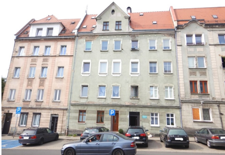
Ogólny widok budynku

na sprzedaż lokalu mieszkalnego Nr 12 znajdującego się w budynku położonym w Lubaniu przy ul. Stanisława Worcella 2 wraz z udziałem we współwłasności nieruchomości gruntowej (działka nr 29, AM 18, Obręb II o powierzchni 156 m 2 , JG1L/00016331/4)